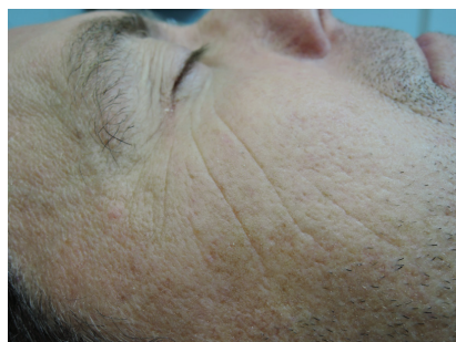
APRÈS 1 TRAITEMENT