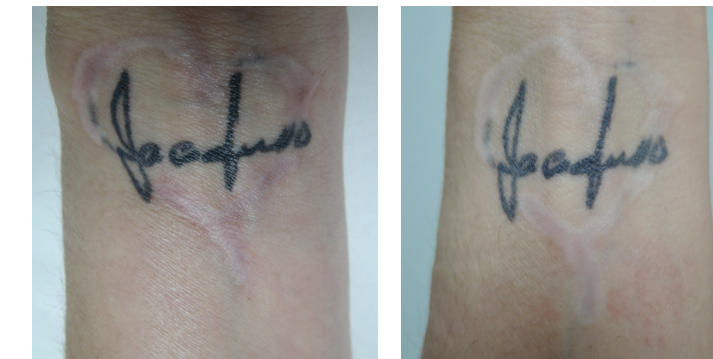
AVANT-APRÈS 2 traitements

Généralement, les résultats sont visibles dès la première séance. Des résultats durables et plus significatifs seront apparents après 4 à 6 séances (espacées de 4 à 6 semaines). La structure de votre peau continuera à s'améliorer au cours des 6 à 12 mois suivant le traitement, en particulier si vous l'associez aux soins post-traitements recommandés.