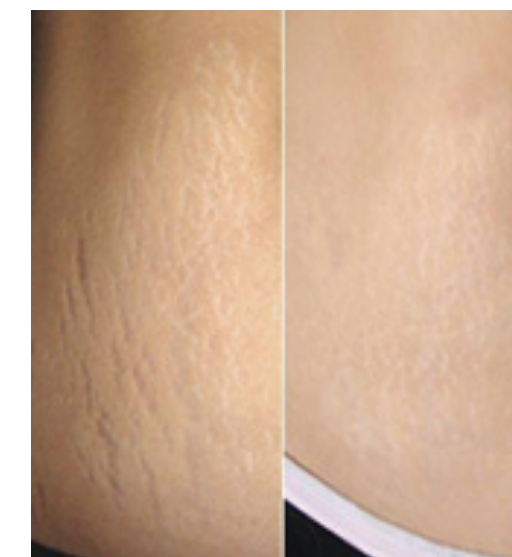
AVANT-APRÈS 4 traitements

Les résultats sont remarquables même sur des vergetures blanches