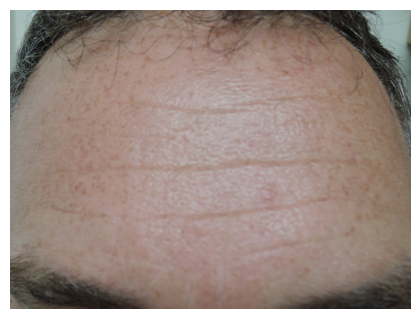
APRÈS 1 TRAITEMENT